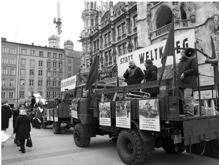
21.2.2015, Antikriegszug auf dem Münchner Marienplatz

Es sind einige Milliarden unseresgleichen auf der ganzen Welt, die kein Interesse am Krieg haben und nur ein paar wenige, die von ihm profitieren. Aber das allein hat bisher auch noch keinen Krieg aufgehalten. Das muss man schon organisieren, den Friedenskampf, den Kampf gegen Rassismus und Faschismus. Und bekanntlich fängt man erst mal klein an. Wir haben begonnen, gemeinsam mit alten und jungen Kollegen aus der tschechischen und polnischen Republik, die Fahrt, die Aufklärung und den praktische Kampf aufzunehmen. Mit einem Konvoi aus Lastwagen machen Kinder, Jugendliche und Arbeiter gerade gemeinsam einen Aktionszug durch mehrere Länder. Durch ein politisches Straßentheater, mit Musik, Reden und vielem mehr, wehren wir uns gegen die deutsche Kriegsvorbereitung. Dabei arbeiten und kämpfen wir zusammen mit unsereins aus den anderen Ländern, weil wir wissen, dass uns weder eine andere Hautfarbe, Ländergrenzen, noch eine Religion voneinander trennen, sondern nur ein Riss zwischen Arm und Reich auf der Welt