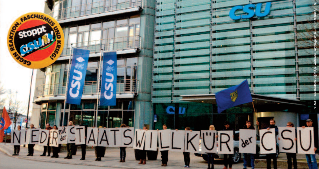
V.l.s.d.r. Freie Deutsche Jugend, M. Wildmoser, Weylengr. str. 14 - 16, 10178 Berlin, E. S.

Faschismus verhindern heißt Kapitalismus stürzen