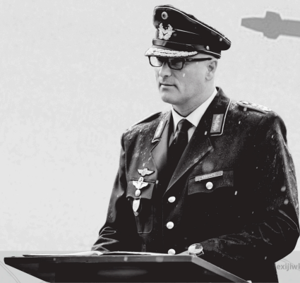
Ingo Gerhartz, Generalleutnant: "Die schießen die Flugzeuge und Raketen ab, die uns schon mal nicht treffen können." Planer der Zerstörung der Krim 2024