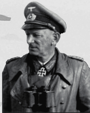
Erwin Jaenecke, Generaloberst: „An und für sich war Guernica ein voller Erfolg der Luftwaffe.“ Schlächter der Krim ab 1943